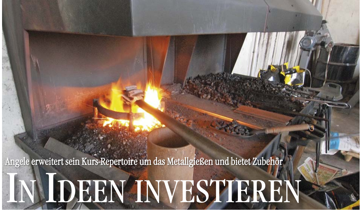
Angele erweitert sein Kurs-Repertoire um das Metallgießen und bietet Zubehör

Gemeinsam wollen sie mit Kurs- und Produktangeboten die Gießertechnik in der handwerklichen Metallgestaltung voranbringen