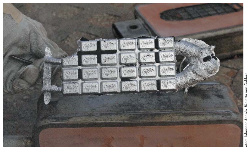
Vom Herdguss- zum »Schokoladen-Ausschmelzverfahren«: Gießerei setzt der Fantasie keine Grenzen