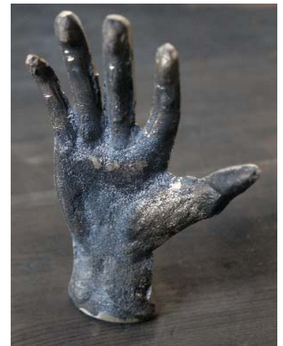
Nachguss einer echten Menschenhand