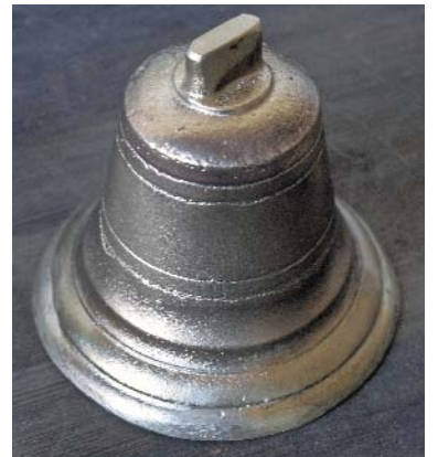
Glocken sind altbekannte Gussobjekte