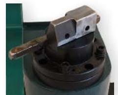
Die Gesenkaufnahme kann in verschiedenen Positionen arretiert werden.